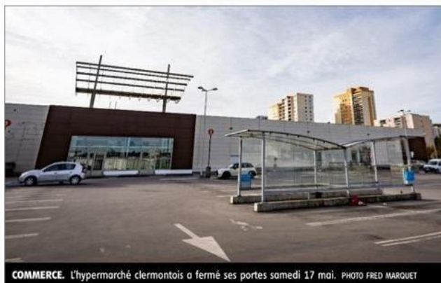
COMMERCE. L'hypermarché clermontois a fermé ses portes samedi 17 mai.

Plusieurs projets sont dans les cartons : il s'agirait d'y installer le centre de secours principal de Clermont-Ferrand, capable d'accueillir plus de 100 pompiers, une nouvelle Maison des solidarités,